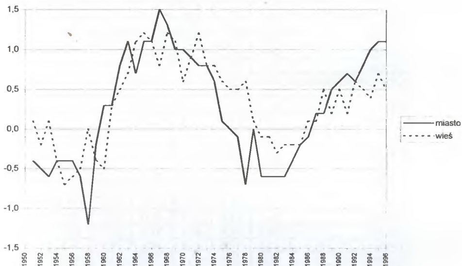
Ryc. 3. Wskaźnik starzenia się demograficznego w Polsce

U_{(>64)t} – udział ludności w wieku pow. 64 lat na początku badanego okresu